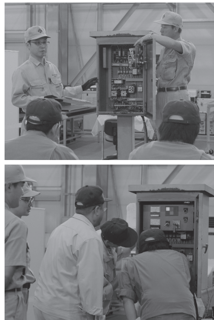
弊社内工場実習風景

3つ目は「回路図から故障原因を考える」です。メーカーでは障害発生のご連絡をいただいた際、様々な状況確認をさせていただき、その情報を回路図などの図面と照らし合わせ、原因箇所の想定をしております。そうすることで現場での復旧作業を確実なものとするほか、現場到着までの移動中における応急措置などのお願いができています。これらの一連をご理解いただけるよう、講義では簡単なシーケンス図の見方などについてご説明させていただきました。