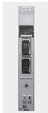
【写真】 IED適用保護 継電装置外観

IED保護リレーは欧米で開発されたため直接接地システムを主な適用範囲としており、日本国内で多く適用されている抵抗接地システムや非接地システムへの適用に際しては実用化に向け検討すべき課題がありますが、今回の保護継電装置の設計において得られた知見をベースとし、お客様のニーズに合致した形での適用範囲の拡大、また構内伝送の国際標準IEC61850を適用した新たな保護制御システムの実用化について検討を進めていく所存です。