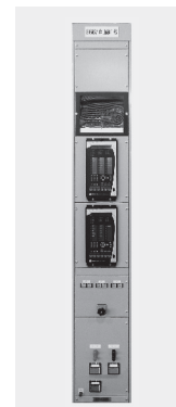
【写真】 IED適用保護 継電装置外観

IED保護リレーは欧米で開発されたため直接接地システムを主な適用範囲としており、日本国内で多く適用されている抵抗接地システムや非接地システムへの適用に際しては実用化に向け検討すべき課題がありますが、今回の保護継電装置の設計において得られた知見をベースとし、お客様のニーズに合致した形での適用範囲の拡大、また構内伝送の国際標準IEC61850を適用した新たな保護制御システムの実用化について検討を進めていく所存です。