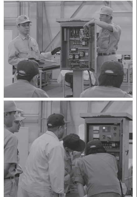
弊社内工場実習風景

3つ目は「回路図から故障原因を考える」です。メーカーでは障害発生のご連絡をいただいた際、様々な状況確認をさせていただき、その情報を回路図などの図面と照らし合わせ、原因箇所の想定をしております。そうすることで現場での復旧作業を確実なものとするほか、現場到着までの移動中における応急措置などのお願いができています。これらの一連をご理解いただけるよう、講義では簡単なシーケンス図の見方などについてご説明させていただきました。