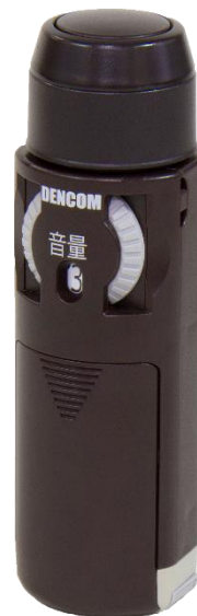
ユアトーン 標準型、ユアトーン 高機能型の背面 (両製品の背面部分は同じです)