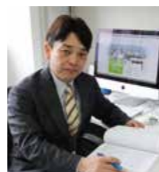
社会医療法人 即仁会 北広島病院 メンタルヘルスケア科診療部 部長 睡眠医療センター長

ところで、ルーチェグラスは、室蘭工業大学と北海道大学で行った臨床研究の結果、さわやかな朝を迎える有用性が認められています。ルーチェグラスは、生活リズムが乱れがちな現代社会において、自分でも気軽に健康管理するための画期的なツールになれると期待しています。