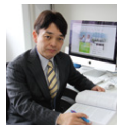
昭和大学 臨床薬理研究所 教授

ルーチェグラスは、室蘭工業大学で行った臨床研究の結果、自覚的な眠気だけでなく、計算問題を指標とした精神運動機能、舌下温を指標とした交感神経機能(覚醒度)のいずれに対しても、効果が見られました。ルーチェグラスは、睡眠覚醒習慣が乱れがちな現代社会において、自分でも気軽に健康管理するための画期的なツールになれると期待しています。