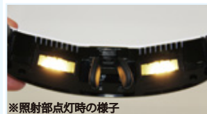
※照射部点灯時の様子