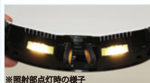
※照射部点灯時の様子